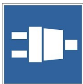
Figure 3 : pictogramme proposé.

Le pictogramme proposé (taille 300x300mm) pour l'unité d'alimentation à quai est le suivant.